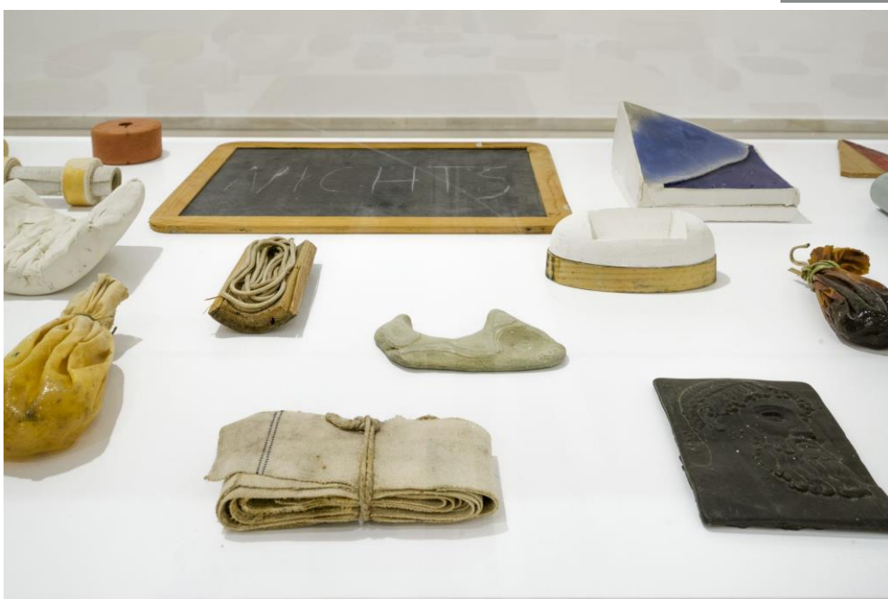
Selección de obxectos