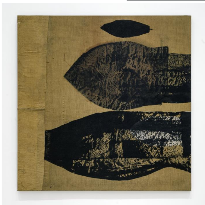
Tres , 1990 Técnica mixta sobre tea 150 x 150 cm Colección privada, Santiago de Compostela