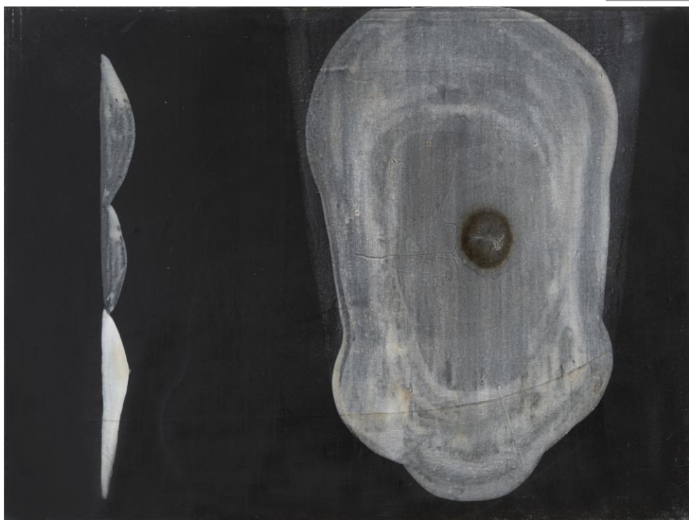
Sin título , 1990