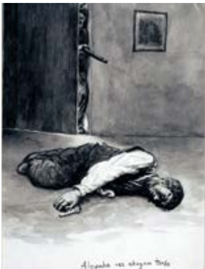
ATILA EN GALICIA

13. Une cada debuxo co seu álbum correspondente: