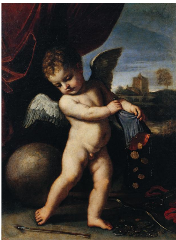
O amor desinteresado exhibiuse no Museo de Pontevedra desde o ano 1929

Con esta nova cesión o Museo Nacional del Prado, que na actualidade mantén depositado no Museo de Pontevedra un importante conxunto formado por 74 obras, permite compensar e substituír o levantamento definitivo de O amor desinteresado , obra de Giovanni Francesco Barbieri, Il Guercino (Cento,1591-Bolonia, 1666), que, tras permanecer na nosa colección desde 1929, regresou a Madrid para ser exhibido nas salas dedicadas á pintura italiana da gran pinacoteca madrileña.