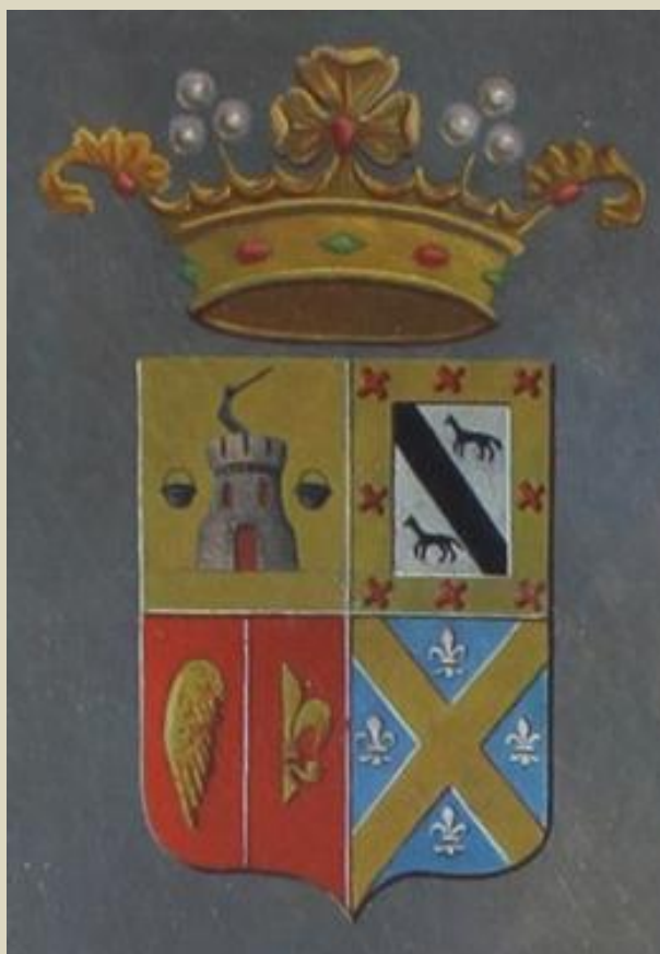
Detalle do escudo do Marqués de Riestra

Na parte superior dereita do cadro, sitúase o escudo heráldico dos Riestra, un escudo cuartelado en cruz, timbrado coa coroa de marqués, amosando no seu primeiro cuartel, o superior esquerdo, as armas do apelido Riestra, aínda que cun erro na súa representación. Así, a descrición heráldica deste apelido sería: en campo de azur 17 , un castelo de ouro 18 , e saíndo do seu homenaxe, un brazo armado, de prata 19 , cunha espada do mesmo metal; a cada lado do castelo, un caldeiro, de ouro. No cadro, a cor azur do fondo é substituída pola cor ouro, o cal supón un grave erro na norma heráldica.