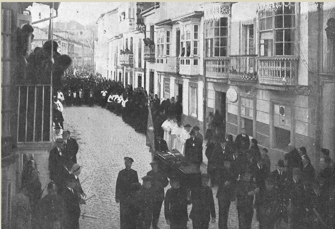
Enterro do Marqués de Riestra

José Luis Ageitos Míguez Gabinete Didáctico