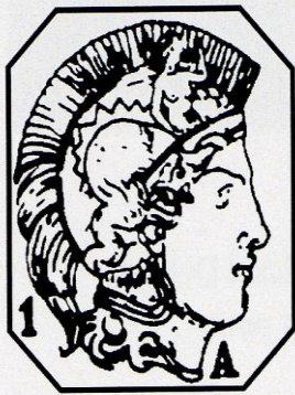
Poinçon tête de Minerve