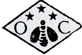
de maître depuis 1935