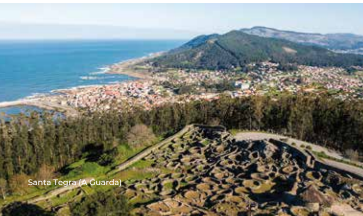
Santa Tegra (A Guarda)

Iso é o que pretende mostrar esta exposición; para iso sérvese dun selecto elenco de obxectos arqueolóxicos procedentes de diferentes museos de Galicia e Asturias, ilustracións de gran calidade e impactantes fotografías.