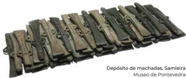
Depósito de machadas, Samieira Museo de Pontevedra

Nun breve audiovisual catro persoas expertas achégannos á singularidade do noroeste peninsular.