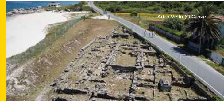
Adro Vello (O Grove)

A Gallaecia cristiá vive un período de renacemento cultural nos ámbitos da historiografía e a teoloxía, pero tamén é a protagonista da creación do primeiro estado xermánico europeo no noroeste da península ibérica: o reino suevo.