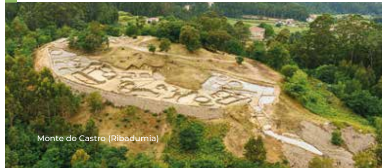
Monte do Castro (Ribadumia)

O predominio cartaxinés primeiro e o gadirita despois abrirá novas rutas e accederá ao mercado atlántico. Eses contactos, así como o desenvolvemento endóxeno dos grupos galaicos, xerarán unha sociedade e unha economía máis complexas.