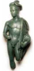
Mercurio, castro de Taboexa Museo de Pontevedra

As sociedades galaicas intégranse no Imperio romano tras a conquista militar do noroeste peninsular (19 a.n.e.), aínda que experimentan un conflito entre tradición e modernidade que se verá reflectido na cultura material e na maneira de dividir e explotar o territorio.