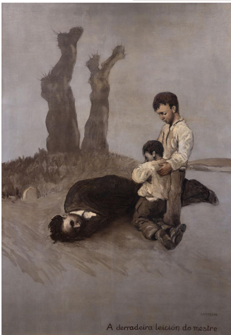
A derradeira leición do mestre

O lenzo reproduce a estampa número 6 de Galicia mártir , o primeiro dos tres álbums publicados por Castelao durante a guerra. Editado en Valencia en 1937, Galicia mártir integra, xunto con Atila en Galicia (Valencia, 1937) e Milicianos (Nova York, 1938), un conxunto que podemos considerar o “Guernica galego”, referente esencial da