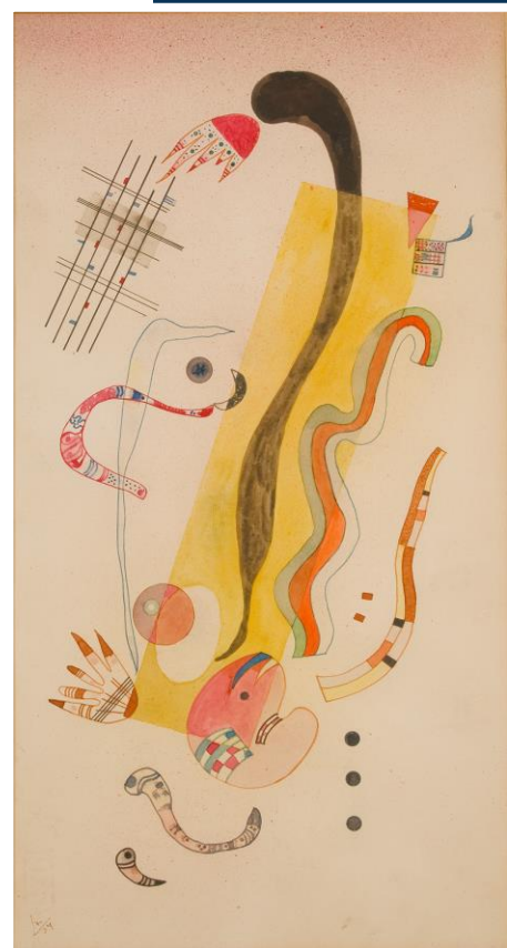
Wassily Kandinsky , (1866 - 1944)