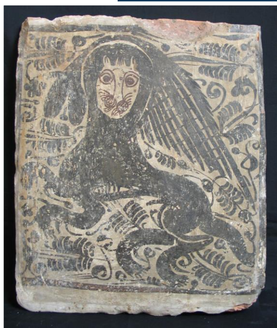
Socarrat con representación zoomórfica Paterna (Valencia), S. XV Barro cocido Colección Museo de Pontevedra