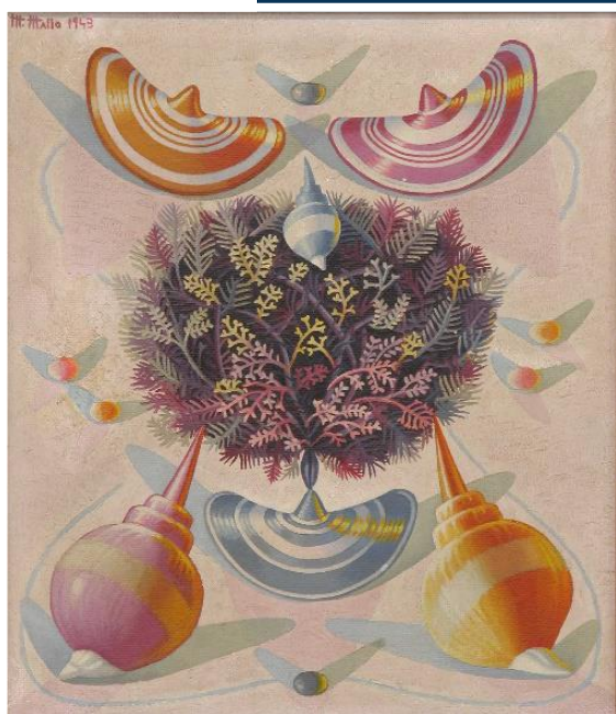
Maruja Mallo , (1902 - 1995) Naturaleza viva , 1943 Óleo sobre tabla Colección FMJJ