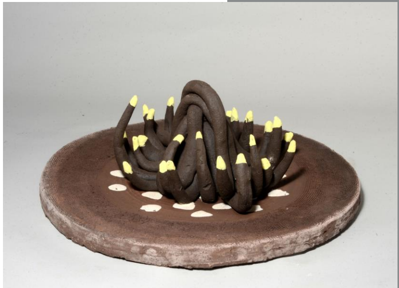
Cerámica metafísica XX

O mural para os Xogos Olímpicos de Barcelona 92 e o mural 'Atopo 92', para a Exposición Universal de Sevilla (1992), o gran proxecto escultórico 'Atlanta Star' (1996), a realización da obra 'Hope for Peace' (1986) como cartel oficial do cume ou a 'Capilla del Milenio' (2000-2001), supoñen un importante fito na súa traxectoria profesional, á vez que inician unha frutífera etapa creativa, que aínda hoxe día mantén, marcada pola colaboración con organismos internacionais como o IOC ou Nacións Unidas.