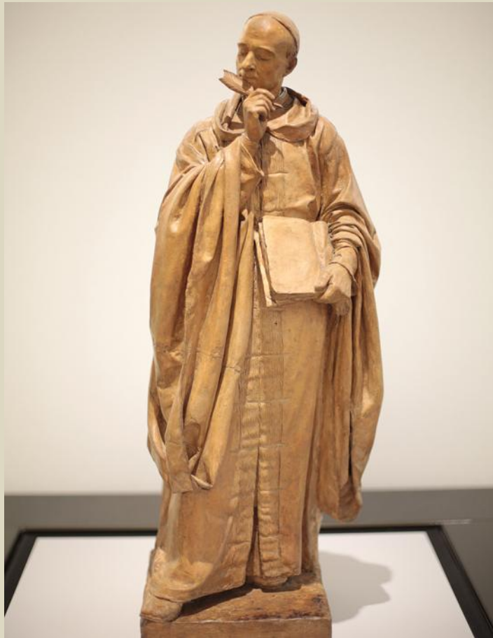
Barro cocido, 68 x 25 x 24 cm

Ó cumprise 250 anos do pasamento do Padre Feijoo, o Museo Arqueolóxico de Ourense organizou a exposición O Padre Feijoo. Cidadán libre da República Literaria , na que se exhibiu o bosquejo que Isidoro Brocos presentou, en 1885, ó concurso convocado para realizar o monumento inaugurado en Ourense en 1887.