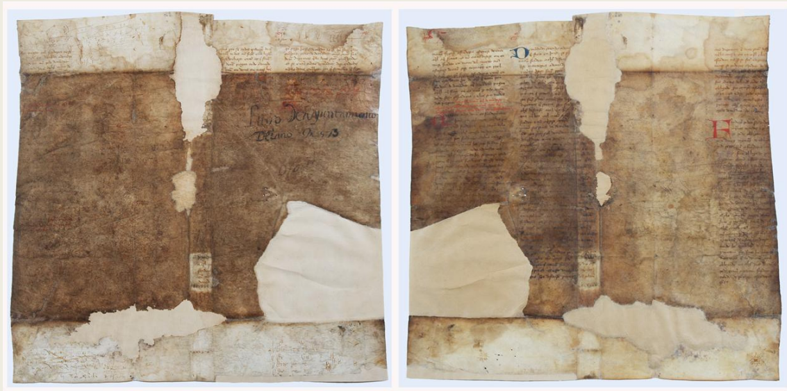
O pergameo despois da súa restauración

Está escrito a dobre columna, en escritura gótica textual e utiliza tres cores de tinta; marrón para o texto, vermello para encabezamentos e azul nalgunha inicial..