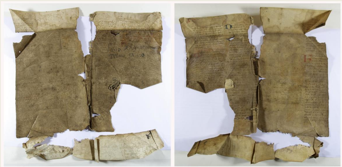
O pergameo antes da súa restauración