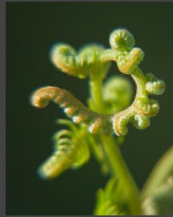
Campo de Valdomar. 1999- 2000 De la serie Fénix