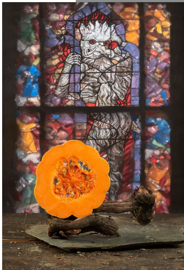
Demo con rosetón De la serie Gastro tempos

Gastro centro / Gastrofuturo (2020-2021)