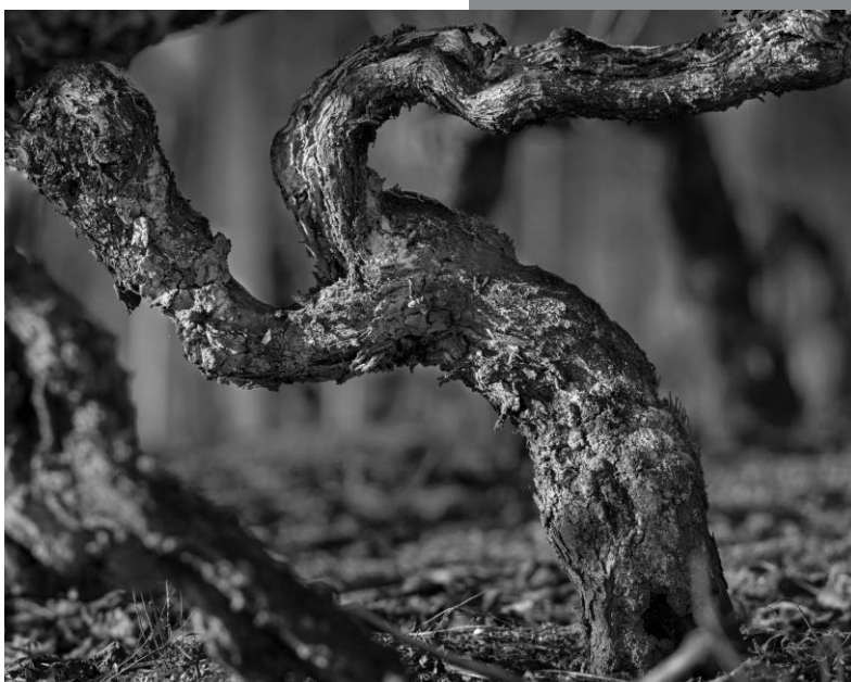
De la serie Cepas vellas