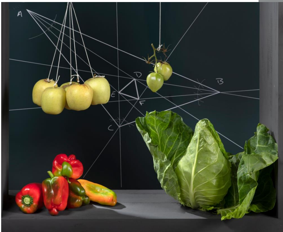
Teorema de Napoleón De la serie Gastro Cotán