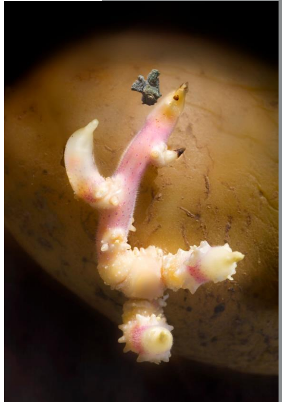
Retablo da pataca e do meu pai De la serie Retablos esenciais

Esta exposición abarca una antología depurada de todas las muestras de Xulio en lo que va de siglo; de ellas solo ha suprimido intencionadamente los retratos y se ha quedado con las propuestas conceptuales. Adoro contemplar las exposiciones en solitario, dejarme llevar por las emociones, pero me perdería buena parte